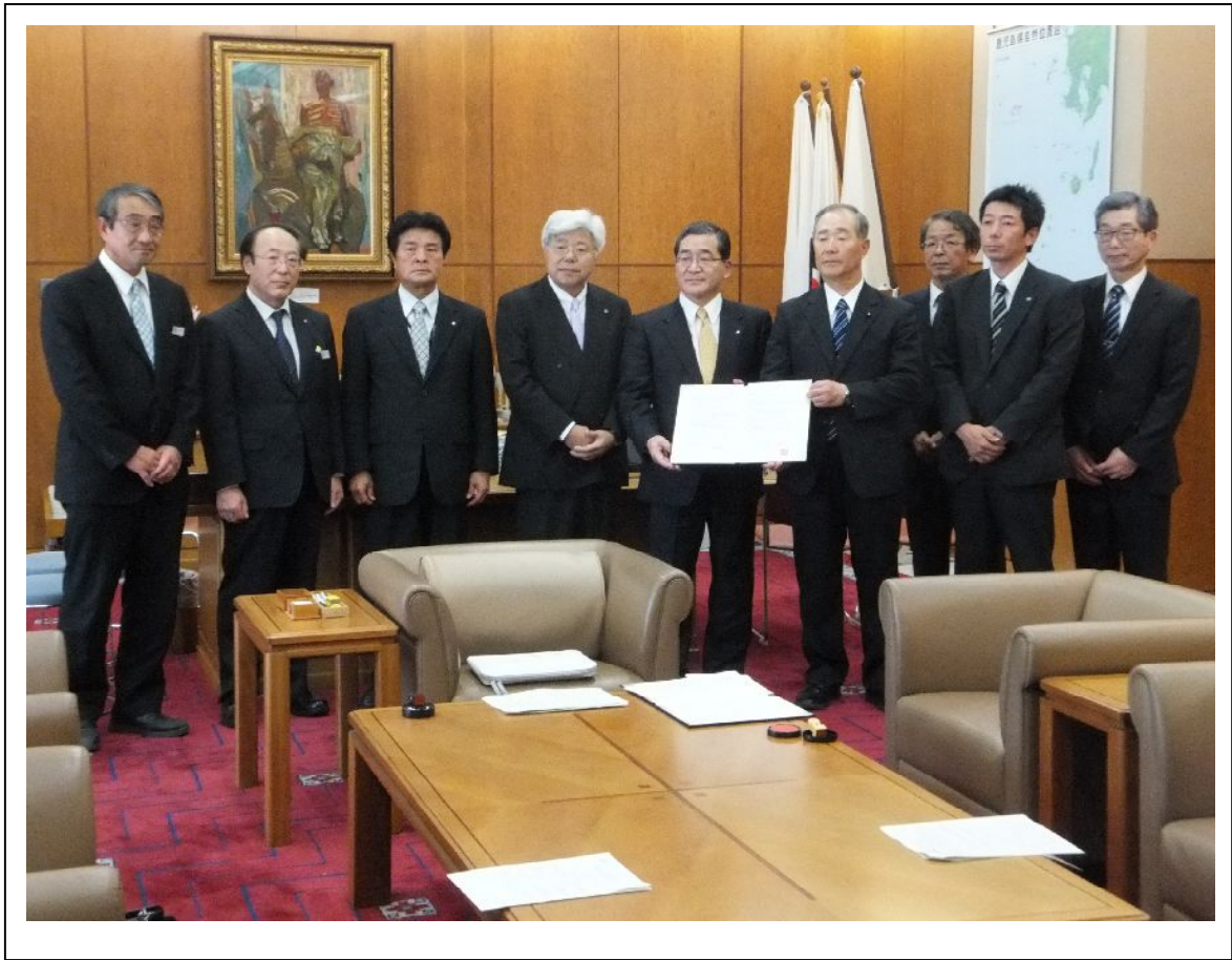
平成26年3月28日 支援協定書調印式：鹿児島県庁知事室